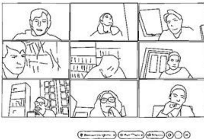
Abbildung 2: Videokonferenz

Im Folgenden möchte ich einen Unterschied zwischen Online- und Präsenzinteraktion herausarbeiten, der diese Wahrnehmung eines Mangels erklären könnte. Er betrifft den Umgang mit differentiellen Standpunkten und Perspektiven. Erkennbar wird dieser Unterschied, wenn man die Blickkonstellationen vergleicht, über die sich Situationen der Präsenz- und der Onlineinteraktion konstituieren. In den Abbildungen 2 und 3 sind zwei solcher Situationen einander gegenübergestellt.